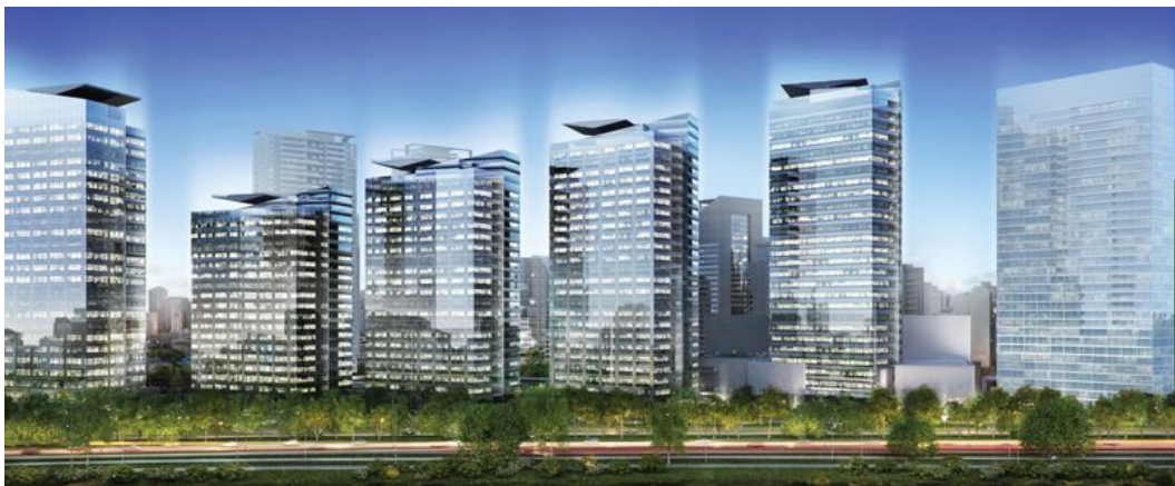
Figura 2: Empreendimento Parque da Cidade.