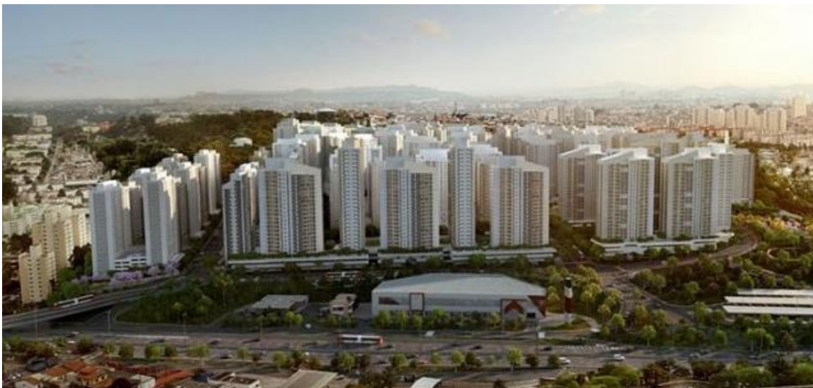
Figura 3: Empreendimento Reserva Raposo.

quadrados de áreas comerciais e “fachadas ativas” 13 . Quando finalizada a construção do empreendimento – planejada para acontecer em diversas fases –, irão morar na região mais de 60 mil pessoas.